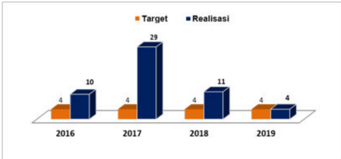
Grafik 2.4. Jumlah Penyelesaian Tindakan Pidana Kelautan dan Perikanan Secara Akuntabel dan Tepat Waktu (Kasus) di Kalimantan Tengah Tahun 2016-2019

Kasus tindak pidana kelautan dan perikanan yang telah diselesaikan di Kalimantan Tengah masih didominasi kasus Illegal Fishing baik di perairan laut maupun di perairan umum daratan dengan jumlah kasus 42 kasus atau sebesar 96,30% dan kasus pencemaran perairan sebanyak 2 kasus atau 3,70%. Secara rinci sebaran dan jenis kasus yang telah diselesaikan di Kalimantan Tengah tahun 2016- 2019 seperti tabel di bawah ini.