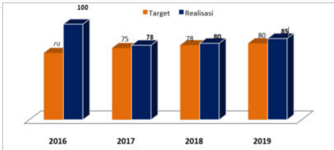
Grafik 2.3. Perkembangan Persentase Kepatuhan Pelaku Usaha Kelautan dan Perikanan Terhadap Ketentuan dan Peraturan Perundang-Undangan yang Berlaku (%) Tahun 2016-2019