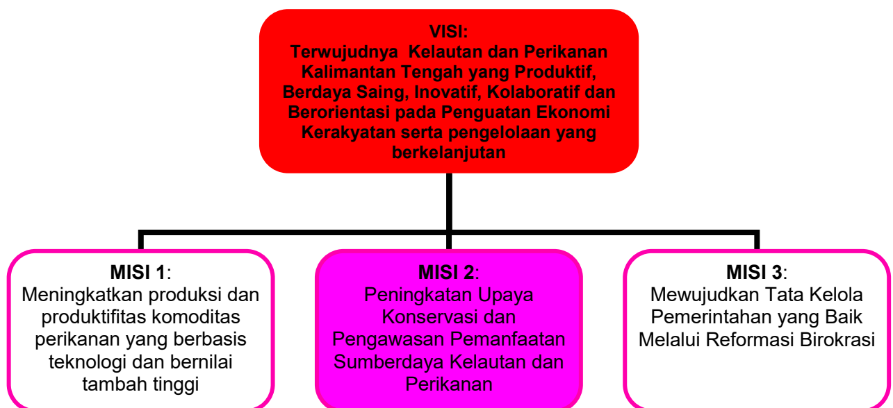
Gambar 4.1 Hubungan Visi dan Misi